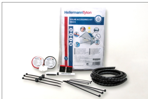
Todo lo que necesitas para tu pequeña instalación solar.