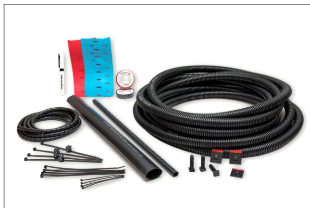
Productos pensados para la instalación eléctrica de autoconsumo solar.