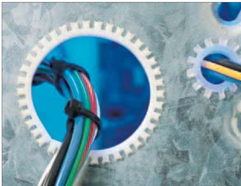
Óptima protección de cables o mangueras sobre bordes afilados.

Los Perfiles de Protección Flexiform, son usados como protección de cables y mangueras que pasan a través de afilados taladros o cantos vivos.